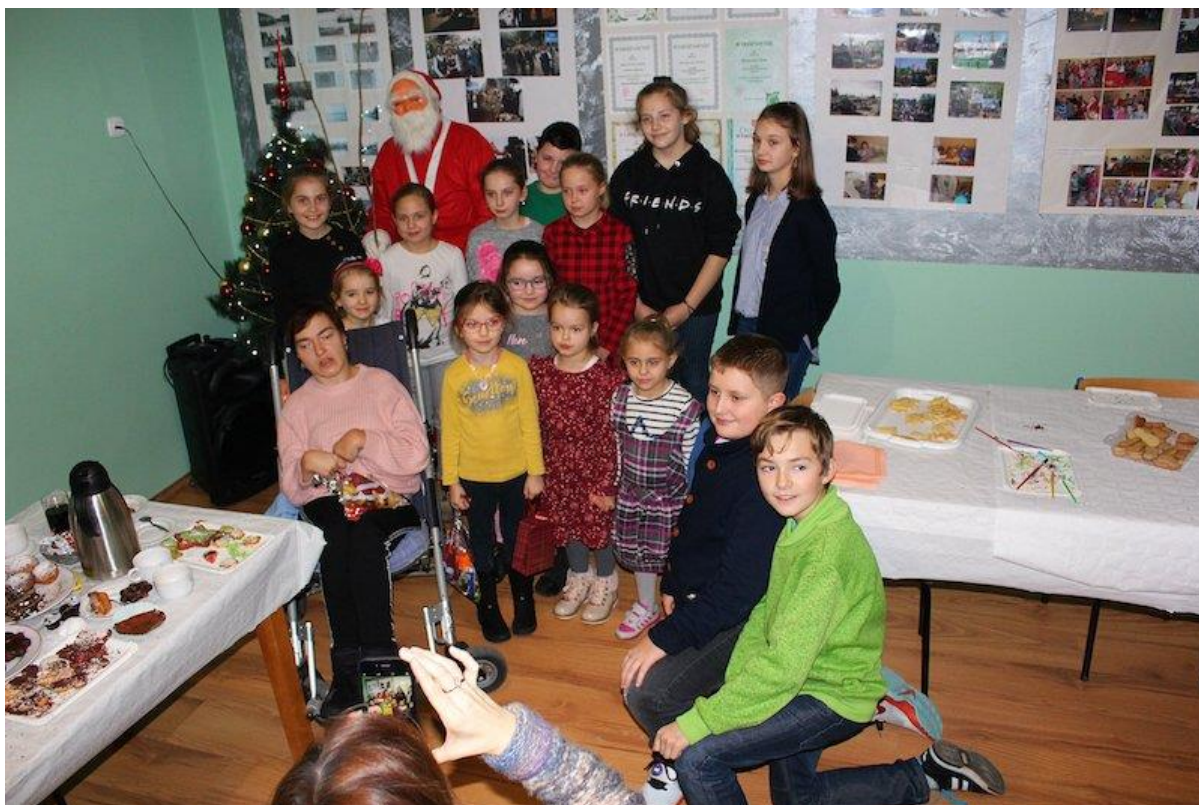
Spotkanie ze Św. Mikołajem