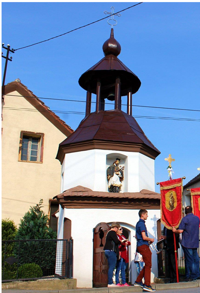
Kapliczka - dzwonnica św. Jana Nepomucena

Na terenie Błazejowie Dolnych zostały wzniesione wśród pól cztery krzyże ufundowane przez przodków mieszkańców wsi. jeden z nich to krzyż św. Urbana; jednak cel i data powstania krzyży są ludziom nieznane.