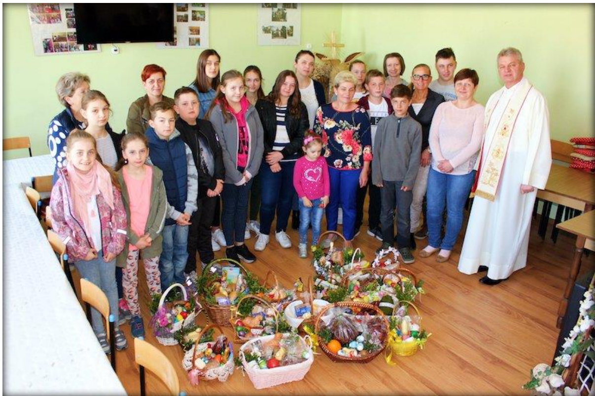
Święcenie pokarmów w świetlicy środowiskowej