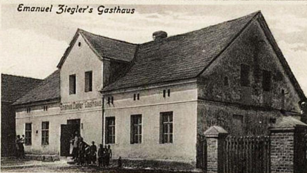
Gruß aus Blaschewitz.