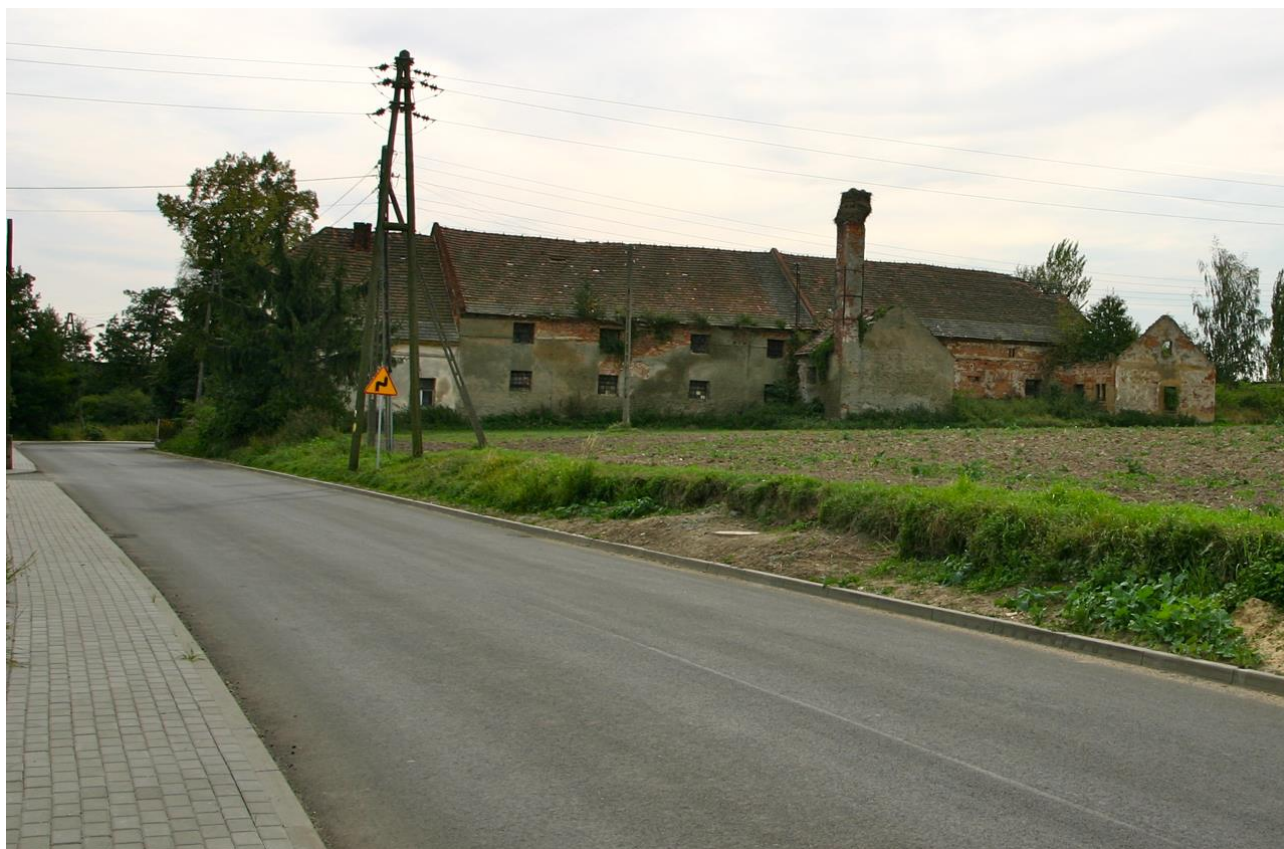
Aktualny wygląd Dominium

Obecnie w skutek procesu depopulacji wiele budynków jest niezamieszkałych i popada w ruinę na czele z budynkami wielkiego Dominium.