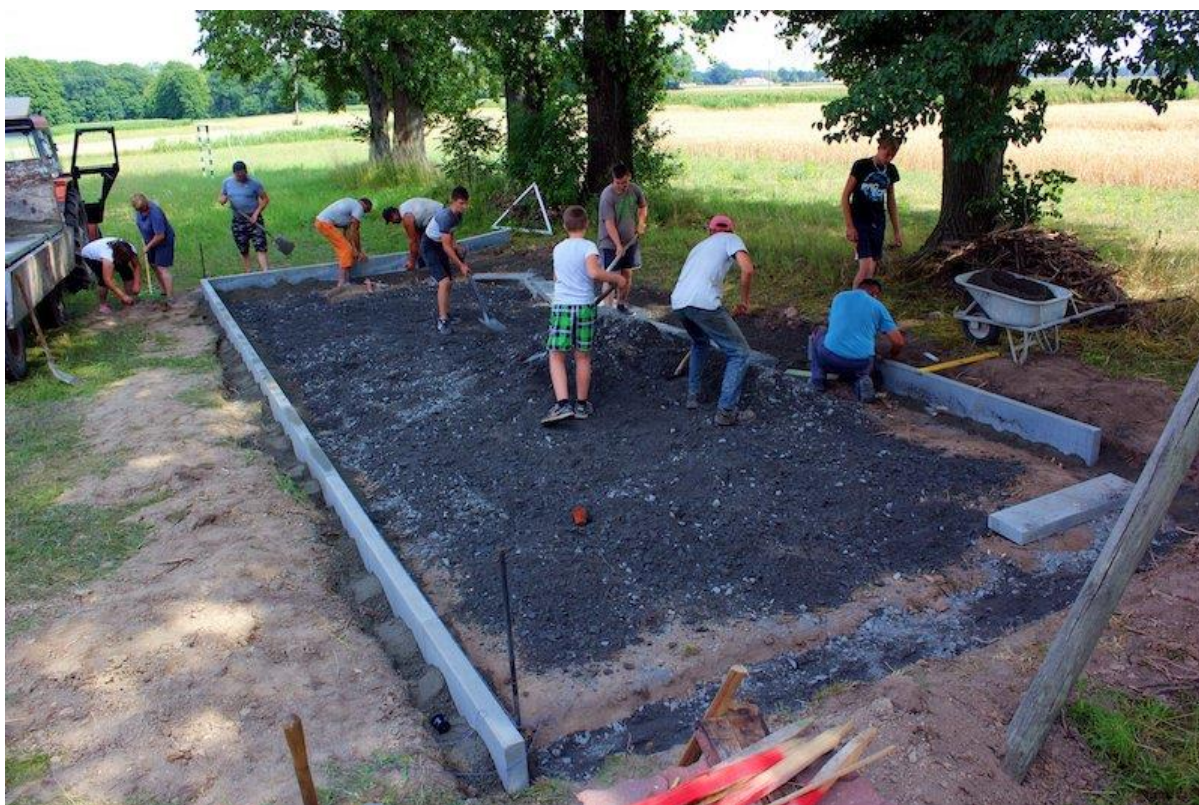
Prace społeczne na boisku