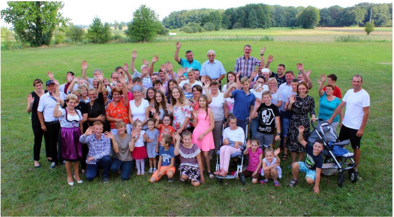
Dożynki wiejskie na boisku