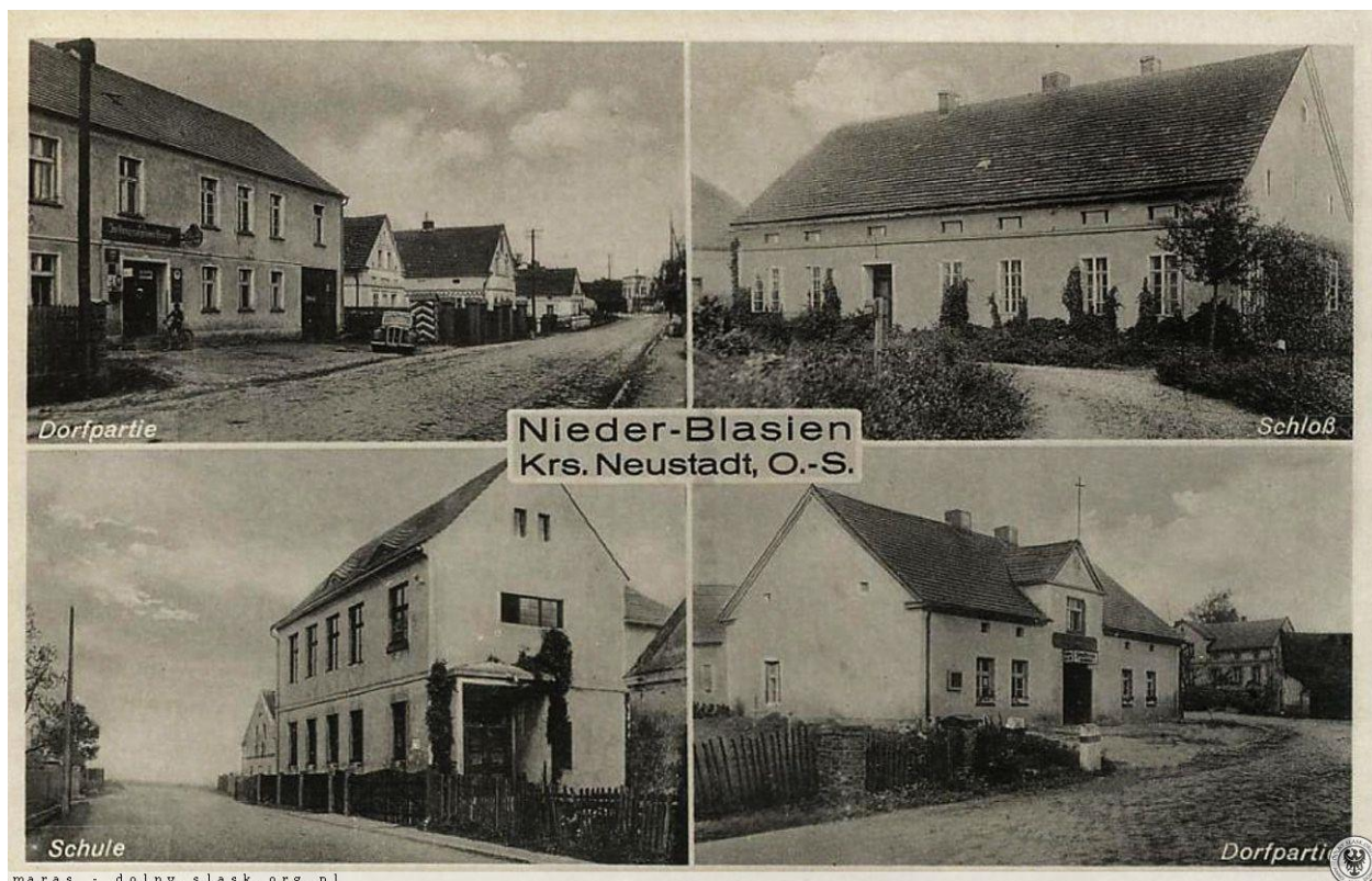
Błężowice na przedwojennej pocztówce