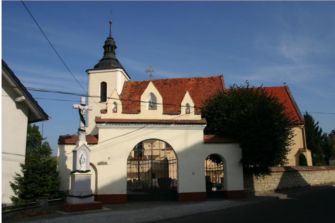
Pomnik upamiętniający poległych żołnierzy z I i II wojny światowej