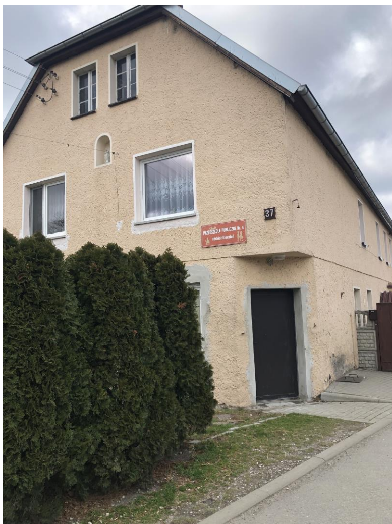
Mieszkańcy własnymi siłami stworzyli miejsca zieleni, które upiększają wieś