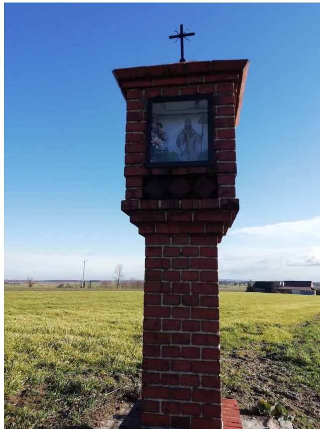
Krzyż Św. Urbana