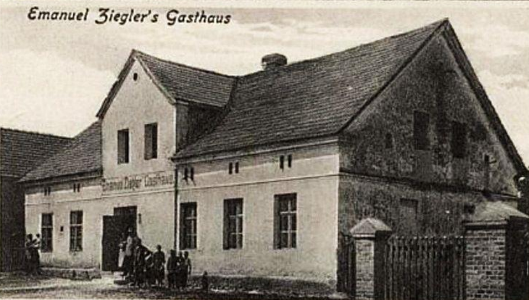
Emanuel Ziegler's Gasthaus