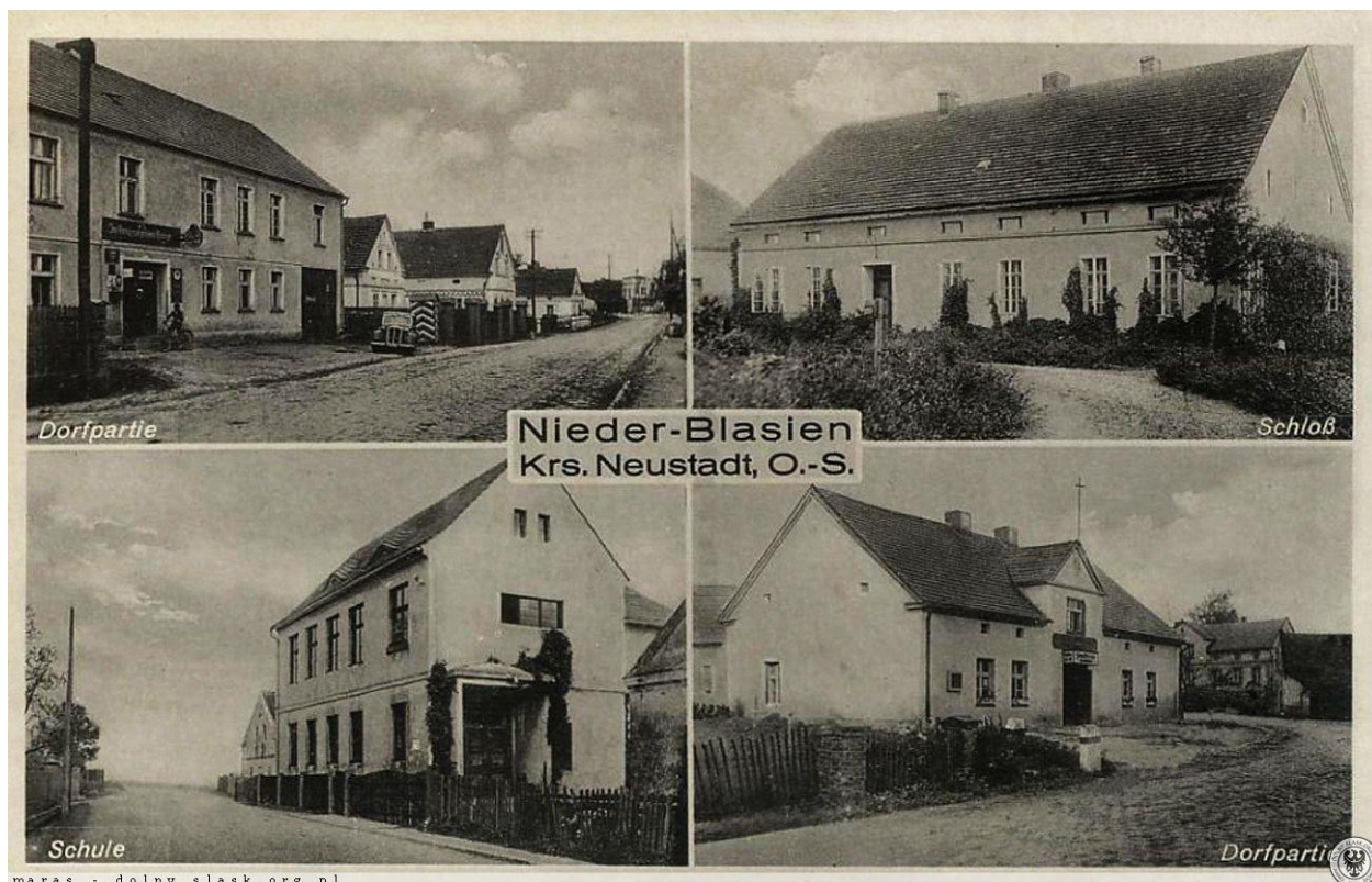
Błazejowice na przedwojennej pocztówce